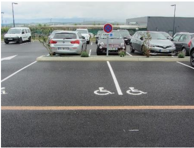
Places de parking